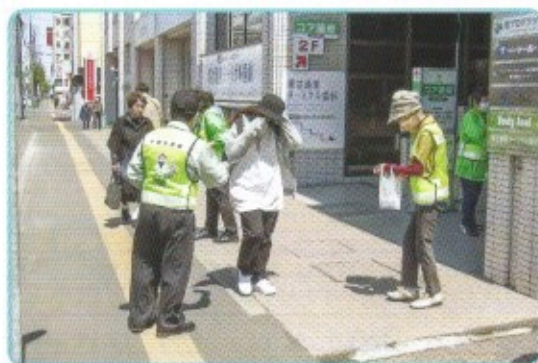
元町地区の街頭啓発(地下鉄環状通東駅)

民生委員・児童委員の職務は、担当する地域において、常に住民の立場に立って相談に応じ、必要な援助を行い、社会福祉の増進に努めることであり、民生委員法により無報酬とされ、その身分は特別職の地方公務員とされます。