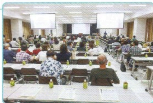
東区民児協全体研修会(自治労会館)

委員さん方は、日々研鑽にも励んでいます。右の写真は東区全体の研修会です。精神障がいや閉じこもりといった難しいテーマでしたが、真剣に向かい合っています。