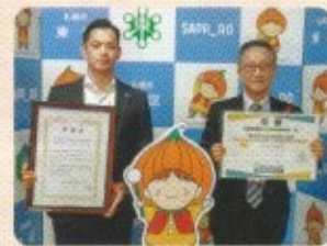
明治安田生命相互会社 札幌支社 様