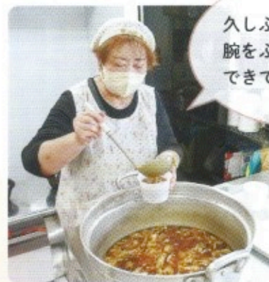
元町まちづくり連合会女性部からは、手作りのきのこ汁が振舞われました。