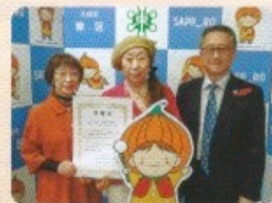
札幌市東区文化団体協議会 様