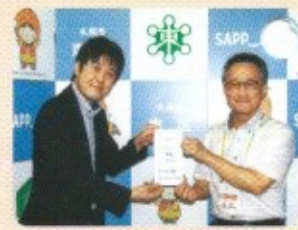
イトーヨーカドー労働組合 札幌支部 様

皆様から頂いた善意は、地域の福祉活動(地域の見守り活動や孤立をしない地域づくり)に活用させていただいております。皆様からのお申し込みをお待ちしております。