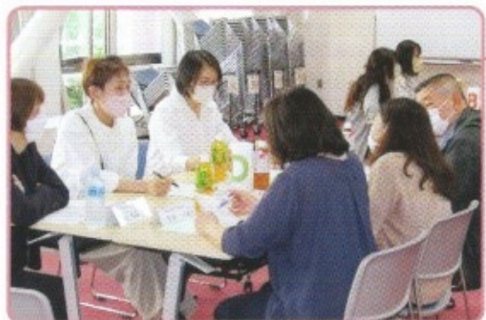
子ども問題に関する主任児童委員研修会(区民センター)

民生委員は、児童委員を兼ねています。児童委員は、地域の子どもたちが元気に安心して暮らせるように、子どもたちを見守り、子育ての不安や妊娠中の心配ごとなどの相談・支援等を行います。一部の児童委員は児童に関することを専門的に担当する「主任児童委員」の委嘱を受けています。