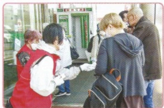
伏古本町地区の啓発(コープさっぽろ新道店)

近年、こうした民生委員・児童委員の「成り手不足」が叫ばれています。東区の場合、8月1日時点で、415名の定員に対し、およそ1割に当たる40名の欠員が生じているのです。2つの写真は、民生委員・児童委員活動について、広くご理解いただくことを目的に実施した街頭啓発の様子です。