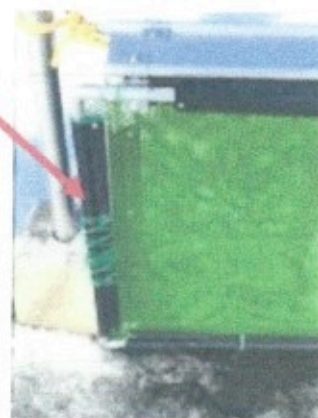
大雪の中での違反ゴミ